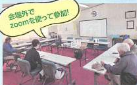
鳥見地区社会福祉協議会の事務所にてフォーラムに参加する様子