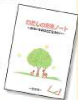
わたしの未来ノート（エンディングノート）