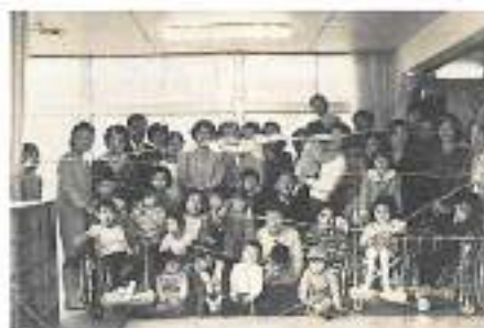
第1回卒園お別れ会