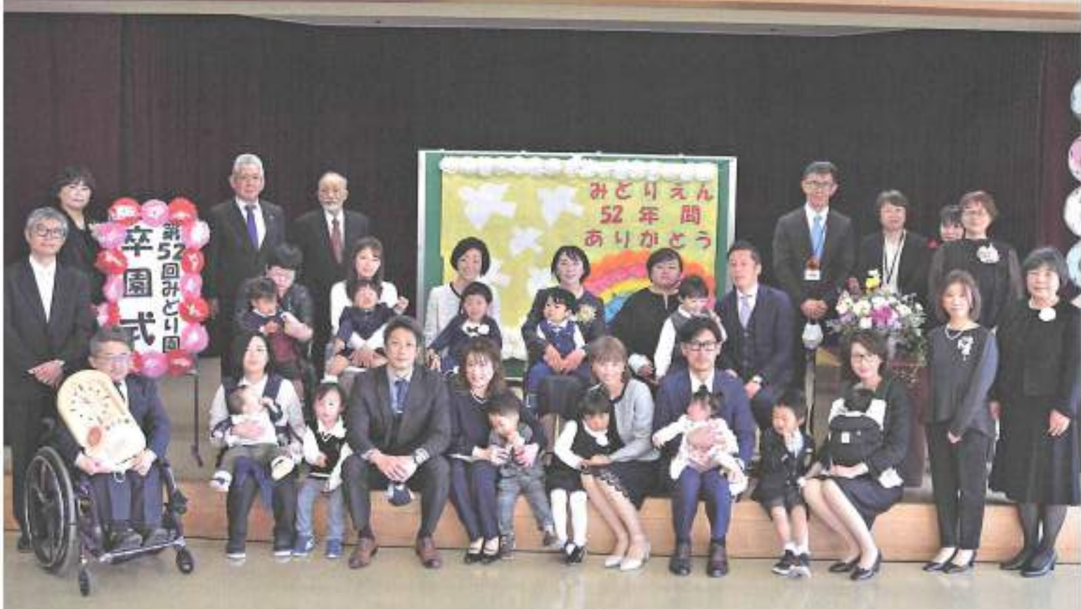
第52回みどり園卒園式