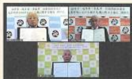
相互支援協定 調印式より

奈良市社会福祉協議会では災害時の支援準備として令和2年度は倉敷市と高知市、令和3年度は福井市と岐阜市で災害時等における相互支援協定を締結しました。災害ボランティア活動の中核を担う災害ボランティアセンター運営支援だけでなく、平時においても研修等を通じて相互の関係性と連携力を深め、災害時における支援の受け入れ体制の強化に取り組んでいます。