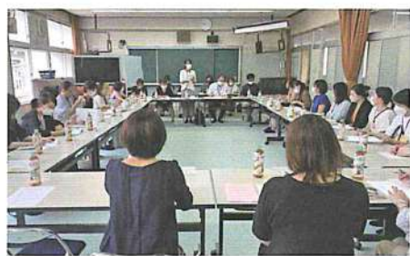
第2回委員総会の様子

四月二十八日(木)第一回目、七月五日(火)に第二回目の委員総会が視聴覚室で開催されました。第一回委員総会では、令和三年度活動報告、令和三年度決算報告があり、令和四年度の活動計画案、PTA総会についての報告がありました。