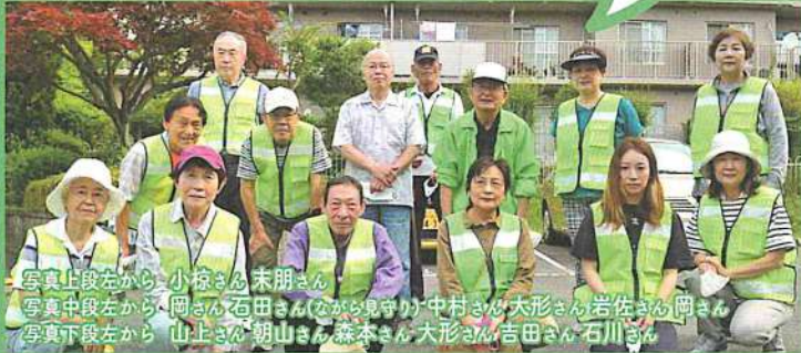
⑤ サンハイツのみなさん 毎日2名のローテーションで登校時の立哨