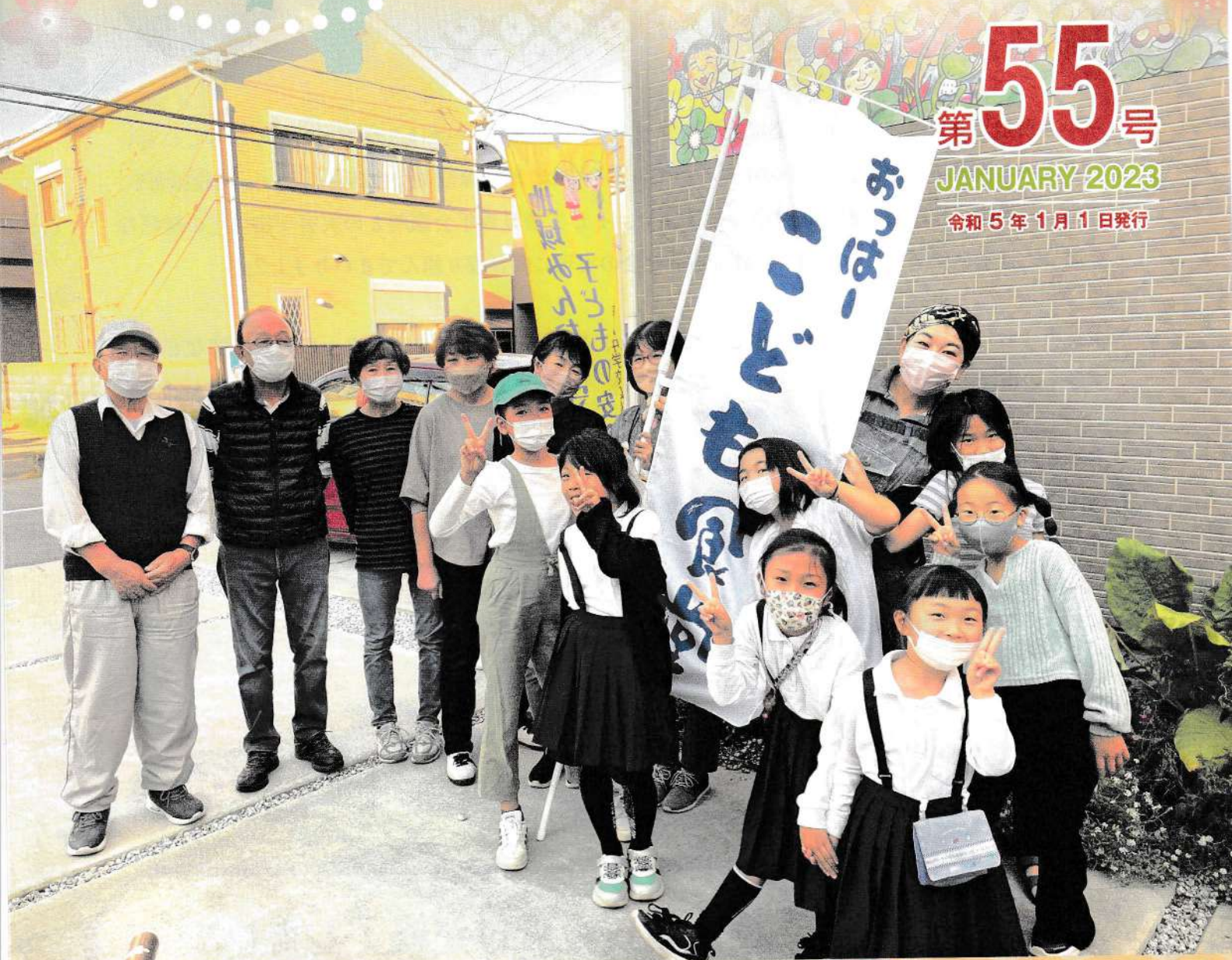
おっは〜子ども食堂にて