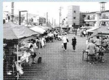
ふれあい朝市のようす

地域自治協議会メンバーで運営に当たっていますが、生涯学習センターや春日公民館からの応援も得ながら、綿菓子や珈琲などの直営もしています。