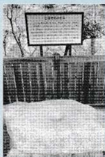
地名の由来となった碓(からうす)

学園三碓地区は令和4年4月1日現在、全体で6,009世帯、人口は14,433人です。