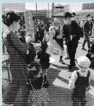
ハロウィン(秋祭り)のようす

最近の連合会の活動としては、令和4年10月にハロウィン(秋祭り)を催しました。従来大和町青年団が中心になって行っていた夏祭りがコロナ禍で中断していましたが秋祭りとして開催方向と知り、一緒にやろうとお願いして、青年団、地元商店街と初めて三者共催の形で開催しました。連合会は子どもじゃんけん当て物を出店し約300人のお子さんが参加してくれました。11月