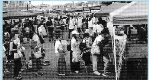
ちびっこ夏祭り(済美南地区)