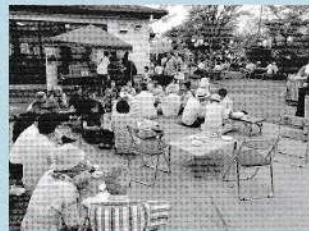
ふれあい居酒屋(朱雀地区)