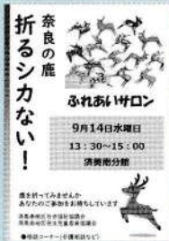
イベントの案内 (済美南地区)