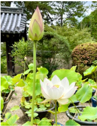
↑ 唐招提寺の蓮です