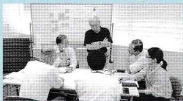
地域の現状・課題についてグループで話し合うようす

初回は地域の現状・課題を抽出し、その解決策について意見を出し合いました。第2回は前回で挙げた課題解決の糸口として、各地域団体の活動を「自己完結型」から「連携