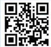
伏見地区自治連合会ホームページQRコード

また、連合会では今年度の特徴として総務・環境・広報委員会を立ち上げ、各分野に分かれて課題等に取り組むようになりました。特に住民の方に地域の動きがわかるように伏見地区自治連合会のホームページを立ち上げ、ネットワークを広めています。各団体の活動状況も分かるホームページにしています。