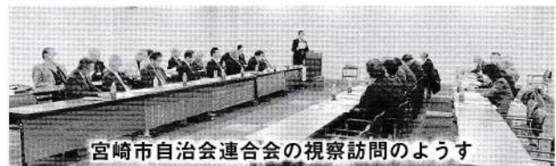
宮崎市自治会連合会の視察訪問のようす

視察内容は、地域自治協議会設立や安心安全なまちづくりへの取り組み、自治会の活性化についてなどで、意見交換をするなかで自治会活動の形骸化、加入率の低下、防災、まちづくりについてなど、総じてどの自治体も同じ悩みを持っていることが分かりま