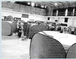
防災訓練での仮設テント 地域では、10月の総合防

昨年までコロナ感染予防対策等で地域のつながりが希薄になり、支えあうまちづくりの活動が停止になるなどこれまでの取り組みが止まってしまいましたが、ようやく、本来の活動を行えるようになりました。