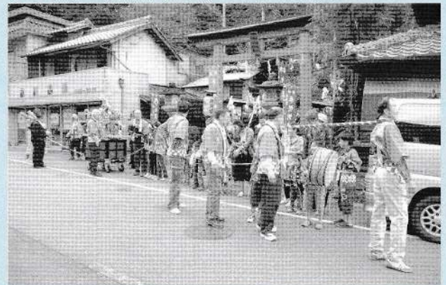
地域の子もたちも伝統行事に参加

時代から400年も続く神事芸能が伝承されています。境内には樹齢500年余りのご神木のイチョウの大木が立っております。九頭神社の歴史有る伝統行事には地域の住民の方々や地域と繋がりのある人々の協力のもと、特に例大祭においては、狭川地区自治連合会も子ども神輿の実施担当として、地域の子も達と伝統行事を守っております。